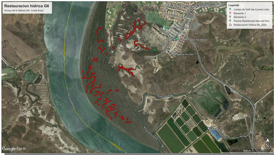
Fig. 7. Cauces a restaurar, en trazos rojos; parcela G6, Costa Esuri.

superior rango jerárquico. La anchura final de los cauces restaurados no superará los 2 m. Los trabajos se llevarán a cabo con una mini-excavadora de orugas de goma (< 5.000 kg de peso máximo) En las zonas donde sea posible, los sedimentos no se extenderán homogéneamente en los bordes de los canales sino en amontonamientos en forma de conos truncados repartidos de forma aislada o en isletas, en orden de evitar el aterramiento difuso, intentando favorecer la recolonización de los mismos por las distintas especies halófitas, y su uso por la fauna