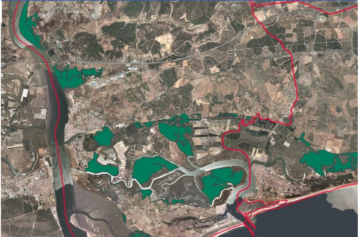
Fig. 2. Distribución de las parcelas de tratamientos antilárvidos en focos situados en ecosistemas de marisma mareal (en verde).

Parcelas: C4, G1, G2, G3, G4, G5, G6, G7, G8, G9; superficie aproximada 612 hectáreas.