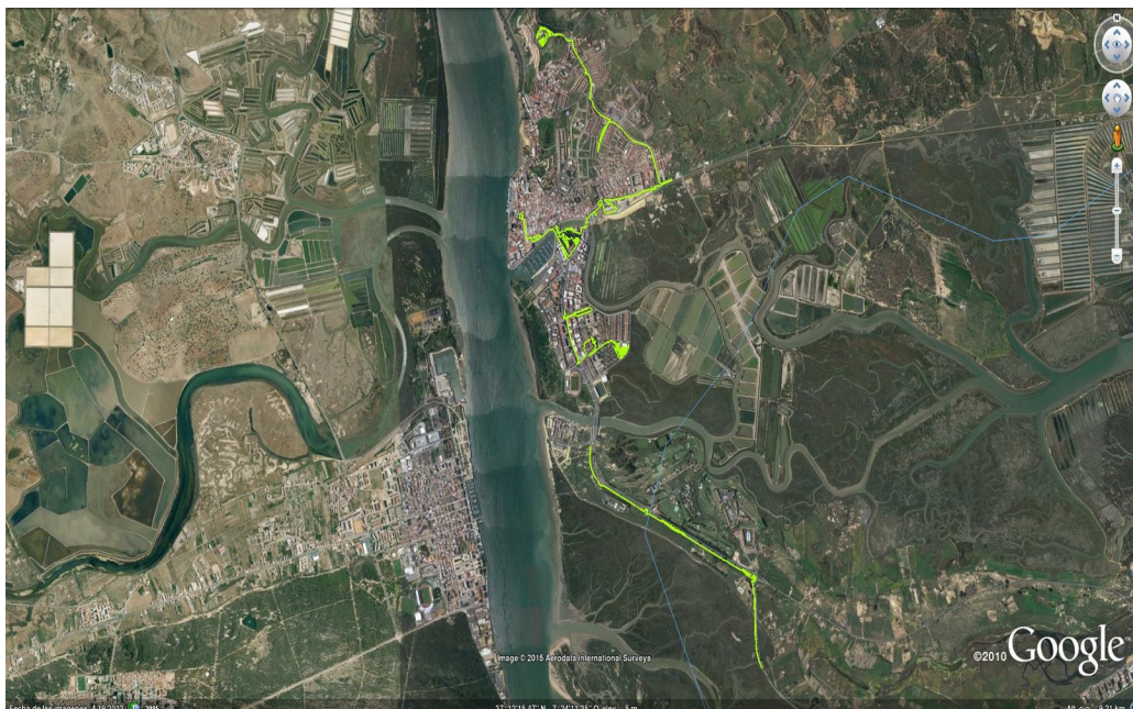
Fig. 4. Distribución de las zonas de tratamiento barrera.