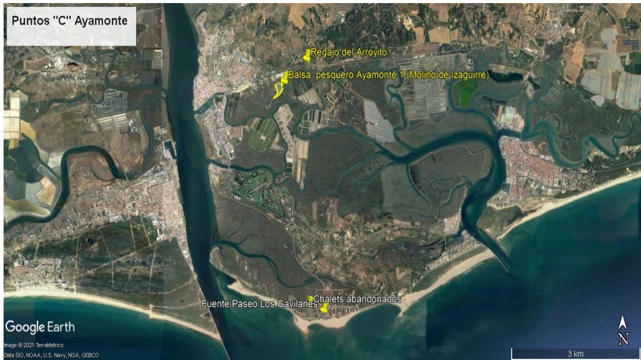
Fig. 3. Distribución de las puntos o zonas de tratamientos antilárvidos en focos de cría de especies del género Culex spp.